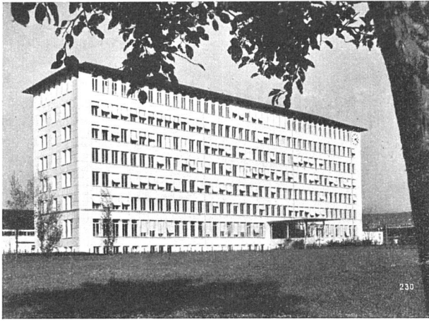
Geschäftshaus in Zug