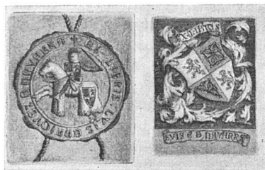
Spanisches Exlibris, Familiensiegel und -wappen