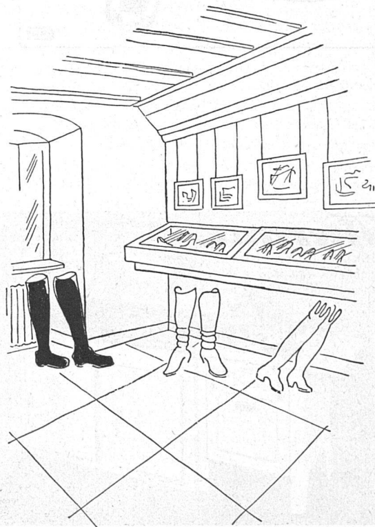
Im Bally-Schuhmuseum Schönenwerd