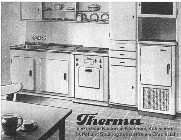
Therma elektrische Küche mit Kochherd, Kühlschrank- buffet und Spülrog aus rostfreiem Chromstahl

Bahnhofstrasse 18, Zürich Gleiches Haus in St. Gallen