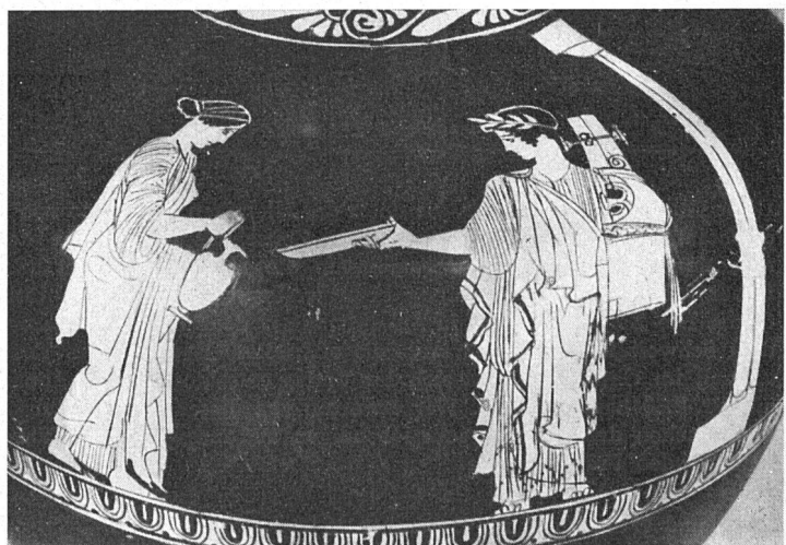
Apollon als Kitharspieler im Heiligtum, von einer Muse beim Spendeopfer bedient. Von einer attischen Hydria um 430 v. Chr. Bern, Historisches Museum.

Dennoch war es die griechische Kunst, die das Bild der Berner Ausstellung beherrschte. Man hat auf die antiken Bodenfunde in der Schweiz im allgemeinen