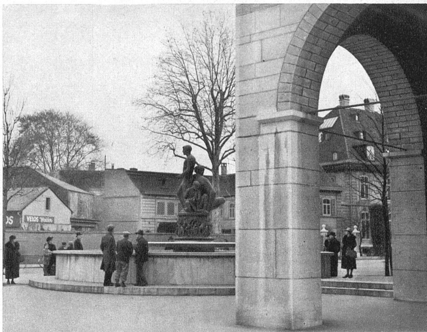
Blick durch die Arkade des Kunstmuseums gegen die Dufourstrasse