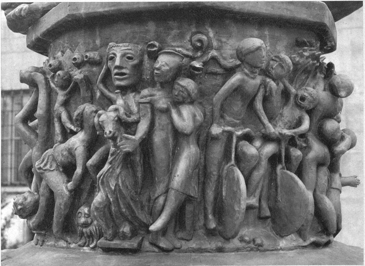
Alexander Zschokke, Basel. Reliefs an der Sockelzone der Brunnen säule des neuen Brunnens beim Kunstmuseum Basel