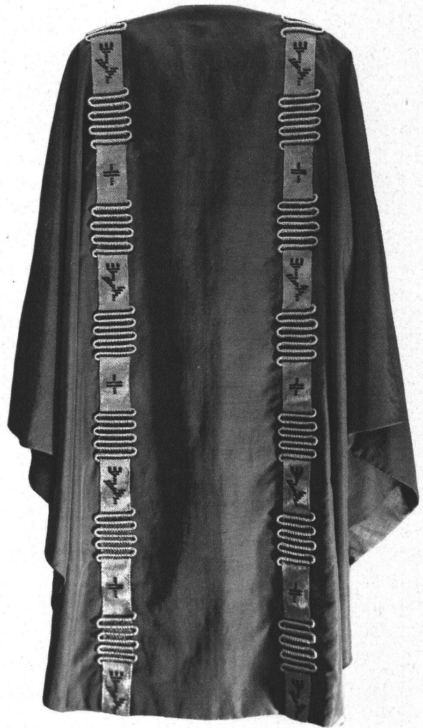
Messgewand aus purpurroter Seide mit gewebten, sehr plastisch wirkenden Borten, letztere aus dunkelblauer und naturfarbiger Seide und Goldkordeln.

Das Messgewand wird vom Priester zur Messfeier getragen. Es ist aus Seide gemacht und hat je nach dem Festcharakter verschiedene Farben. Es reicht von der Schulter bis fast zu den Knöcheln der Füße und über die Schulter bis zum Handgelenk. Es wird aus zwei annähernd halbkreisrunden Teilen geschnitten.