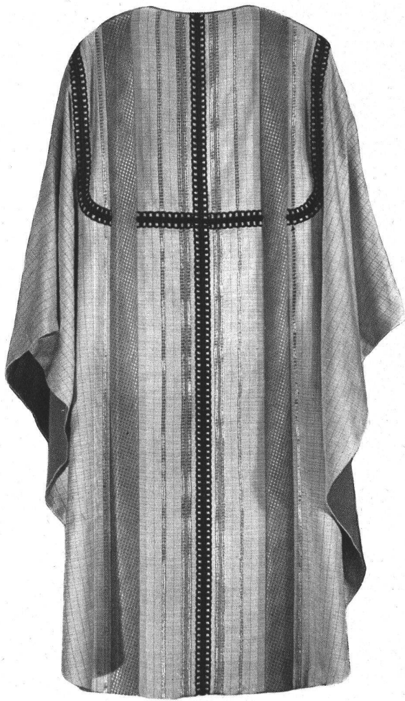
Handgewobenes Messgewand aus ecrufarbiger Seide. Darüber Stäbe in Goldbrokat und Stickerei in Gold und dunkelbronzefarbiger Seide.