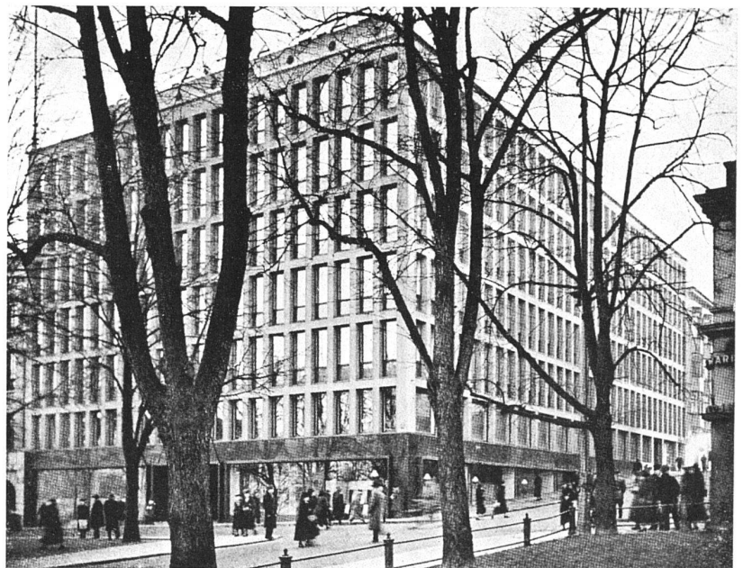
Ansicht von der Esplanade, der Hauptstrasse des alten Helsingfors

Kontorgebäude der Firma Lassila & Tikanoja, Helsingfors Architekt J. S. Sirén, Professor an der Tech- nischen Hochschule Helsingfors