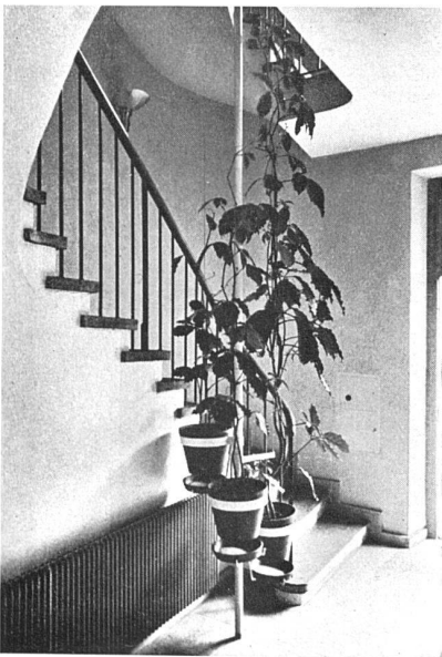
Das alte Treppenhaus renoviert