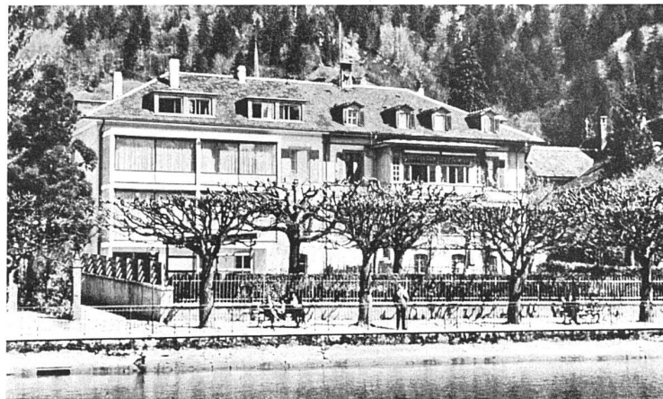
Seeseite und Landseite. Dieser bemerkenswert taktvolle Umbau wahrt nach der Landseite den Gesamtcharakter des Doppelhauses und nach der Seeseite das ungefähre Volumen des Verandenanbaus; es ist auf das Vorhandene Rücksicht genommen, ohne dass diese «Konzession» die Reinheit der Lösung stören würde.