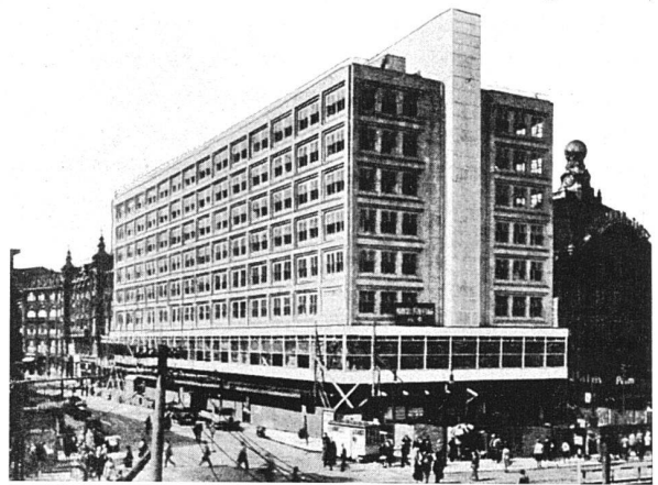
Hochhaus am Alexanderplatz, Berlin, aus «Wasmuths Monatshefte für Baukunst und Städtebau», Band XV, 1931, Heft 7, S. 292

Werke nur bestimmte Seiten ihres Urhebers spiegeln, während andere Züge der Persönlichkeit nicht in das Werk eingehen. Je höher dieses allerdings künstlerisch steht, desto umfassender spiegelt es den ganzen Menschen.