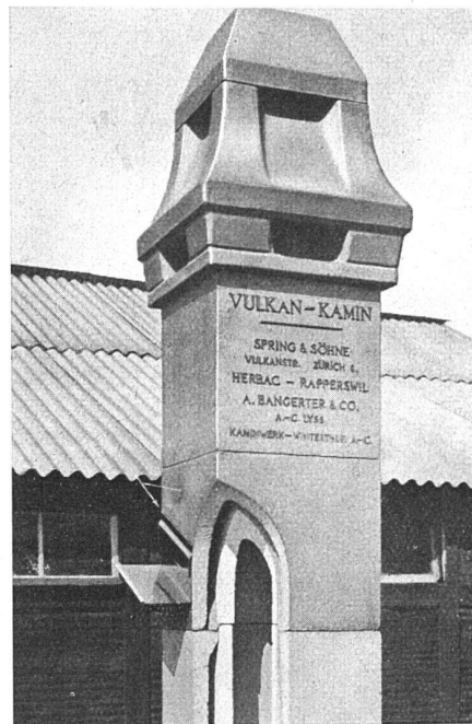
Vulkan-Kamin der Firma Spring und Söhne, Zürich

Dieses neue Verfahren im Kaminbau ist an der LA. (Abt. Zementwaren) in einem praktischen Beispiel dargestellt und sei jedem Architekten und Fachmann zur Berücksichtigung empfohlen. Es handelt sich hier um eine ebenso einfache wie gründliche Lösung der Aufgabe, Kamine wetterbeständig zu machen. S. S.