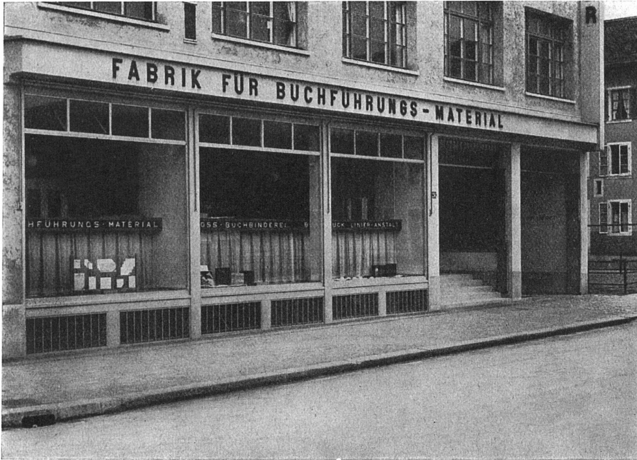
Geschäftshaus Paul Carpentier Söhne, Zürich. Architekten: Debrunner & Blankart, Zürich

Schaufensteranlagen in Eisen, Bronze und Anticorodal. Scherengitter. Sonnenstorenanlagen