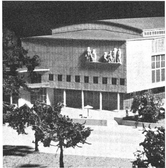
Kongressgebäude Zürich, Ostecke gegen den Alpenquai

Die Stiftung Tonhalle- und Kongressgebäude Zürich beabsichtigt Anfang Januar 1938 unter den seit 1. Januar 1935 im Kanton Zürich niedergelassenen oder in ihm verbürgerten Bildhauern einen öffentlichen Ideen-Wettbewerb über die Gestaltung des plastischen Schmuckes an der Südfassade des Kongressgebäudes auszuschreiben.