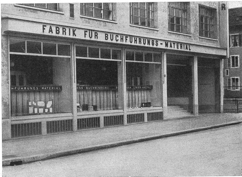
Geschäftshaus Paul Carpentier Söhne, Zürich. Architekten: Debrunner & Blankart, Zürich

Schauensteranlagen in Eisen, Bronze und Anticorodal. Scherengitter. Sonnenstorenanlagen