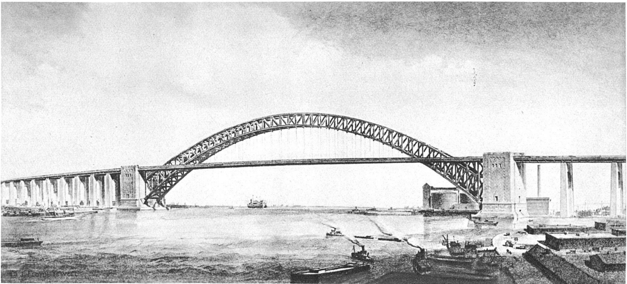
Bayonne-Brücke über den Kill van Kull, New York Erbaut 1926—1931. Bauherr: The Port of New York Authority. Stahlbogen mit einfacher Fahrbahn für Strassen- und Schnellbahnverkehr. Spannweite ca. 480 m, Gesamtlänge mit Zufahrten 2400 m