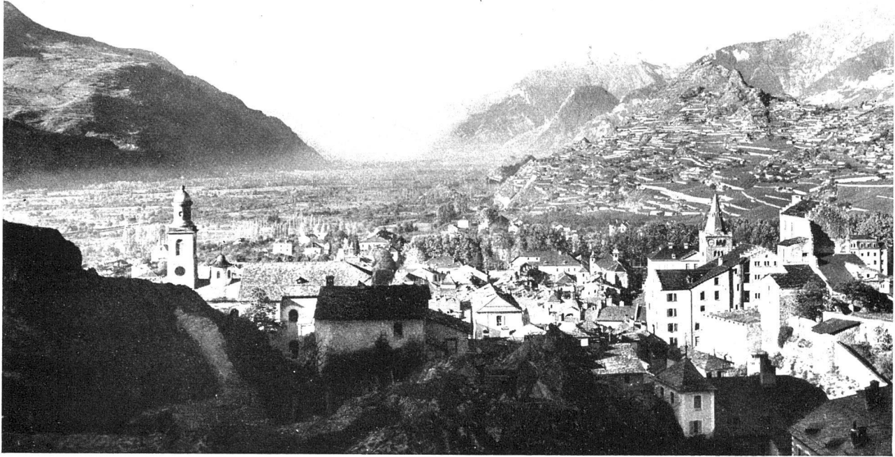
Sitten, vom Schloss Valeria gesehen Mitte: Sitten, Schloss «La Majorie» unten: «Château du Muzot» bei Siders, wo Rainer Maria Rilke seine letzten Lebensjahre als Gast des Besitzers verbrachte

Kirche von Raron und die von Visp sind eben keine «Bürgerhäuser».