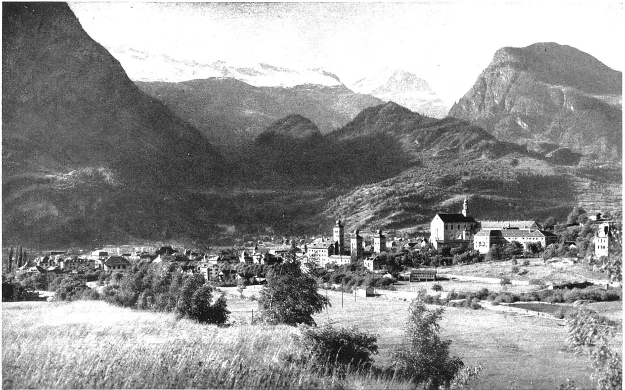
Brig, Gesamtansicht aus Süden gegen den Aletschgletscher, in der Bildmitte der Stockalper-Palast (Baubeginn 1642), rechts Jesuitenkolleg Mitte: Das alte Stockalperhospiz auf Simplonpasshöhe, ausgebaut 1655, davor neuere Stallgebäude unten: Das «neue Hospiz» auf Simplonpasshöhe