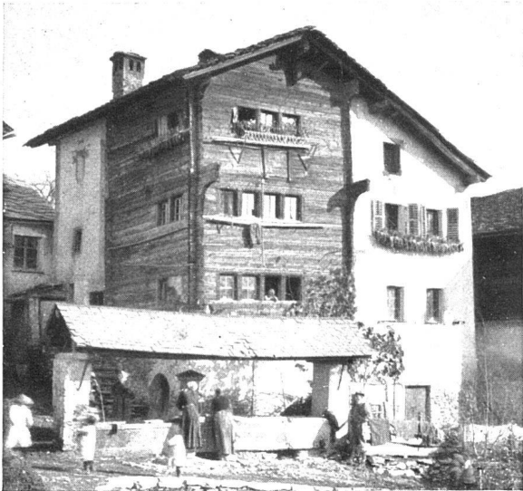
St. Léonard, Haus Jost