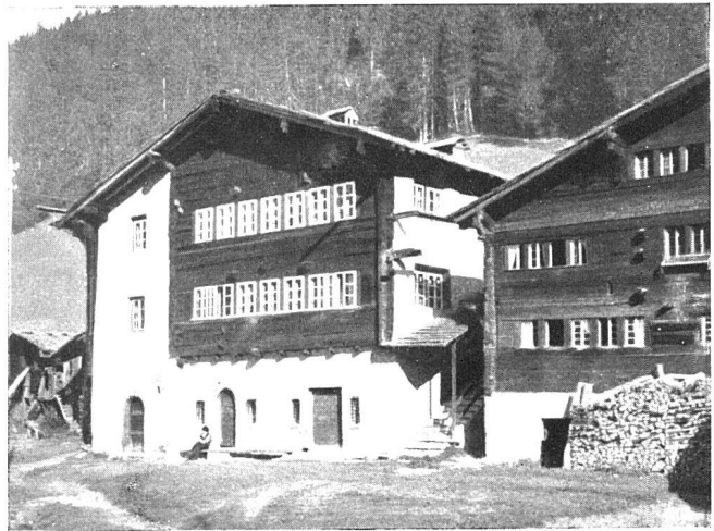
Ernen im Goms, Oberwallis

Aus dem Band «Wallis» des Werkes «Das Bürgerhaus in der Schweiz», herausgegeben vom Schweiz. Ingenieur- und Architekten-Verein SIA (Band XXVII), Orell Füssli Verlag, Zürich.