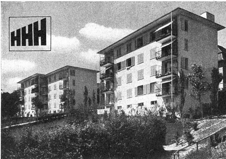
A. B. Z. Kolonie Oeristeig Architekten: Kellermüller & Hofmann

Eternitschiefer in den neuen eingebrannten, wetterfesten Farben ergeben schöne u. dauerhafte Bedachungen