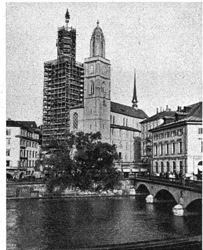
Grossmünster-Renovation, Zürich Nachdem der Südturm vollendet ist, ist der Nordturm eingestüst