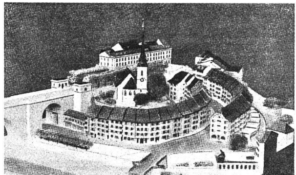
Quartier um Nydeckbrücke und Nydeckkirche

Das Gebiet liegt in der Bauklasse I, für welche viergeschossige Gebäude zulässig sind, der Dachstock darf