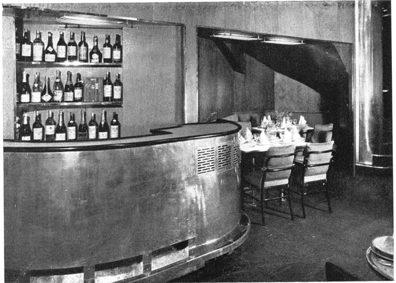
Speisesaal. Wandverkleidung in ungebeizter Eiche, lackiert, Bartheke Aluminium, Tische Metall und Mattglas, Sesselbezüge grünes Rosshaargewebe, Bodenbespannung hellbrauner Velours