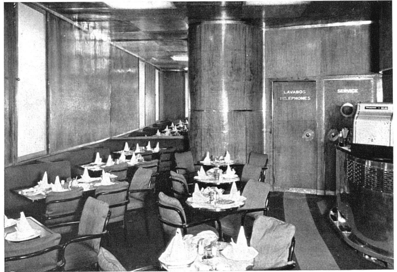
La salle à manger. Les parois sont revêtus de bois de chêne nature vernissé, couverture des chaises en tissu de cheveux chevalins vert, le sol est revêtu de velours brun-clair