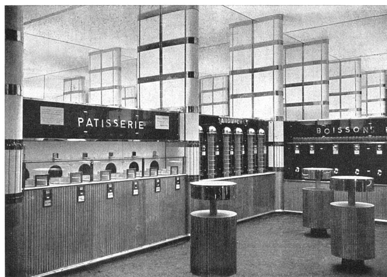
Buffetraum, hinterer Teil Tischchen aus Aluminium und Mattglas