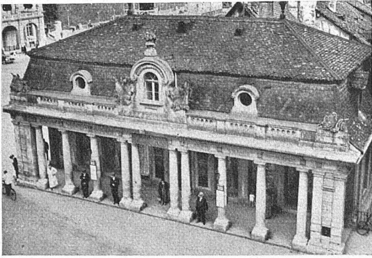
Die alte Hauptwache, erbaut von Niklaus Sprüngli 1768; rechts oben: der Engpass vom Theaterplatz zum Kasinoplatz, darunter die Hauptwache mit den kolossalen «Ryserbauten»