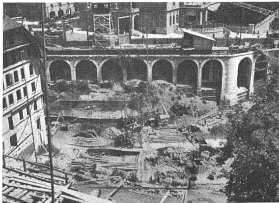
Die Baustelle (künftige Grossgarage) gegen die Kirchenfeldbrücke hin

Ueber die architektonische und städtebauliche Gestaltung des Platzes ist man heute mehr als je im ungewissen. Laut dem in der Abstimmung vom Dezember 1934 sanktionierten Alignementsplan sollte die alte Hauptwache stehen gelassen werden, ihretwegen hat man grosse Opfer auf sich genommen, so zum Beispiel die unerfreuliche Gestaltung des Anbaues ans Hôtel Du Théâtre usw. Im Werk Nr. 5, 1934, sind einige kritische Bemerkungen hierüber angebracht worden. Jetzt, da die Bauarbeiten in vollem Gange sind, munkelt man allerlei über verschiedene Abänderungen in bezug auf die Hochbauten, und in einem alarmierenden «Bund»-Artikel wird sogar die Nachricht verbreitet, die kantonale Regierung hätte nunmehr die Absicht, die Hauptwache doch wegzunehmen, um eine günstigere Platzgestaltung zu ermöglichen. Vorausgesetzt, dass diese Absicht wirklich besteht, so wäre der angenommene Alignementsplan hinfällig, und es fragt sich, ob nicht im jetzigen Moment noch ein neuer begrenzter architektonischer Wettbewerb veranstaltet werden sollte. Die Verkehrs- wie städtebaulichen Verhältnisse haben sich seit 10 Jahren so stark verändert, dass ein gründliches Studium durch die besten Kräfte im vorliegenden Falle wohl am Platze wäre. Inzwischen könnte die begonnene Grossgarage ausgebaut werden.