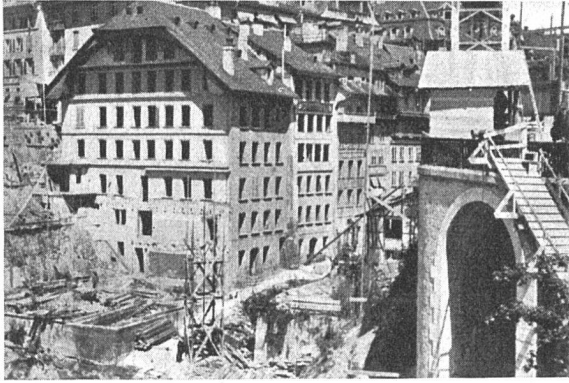
Die abbruchreifen Häuser des ehemaligen Gerbergrabens, rechts Kirchenfeldbrücke