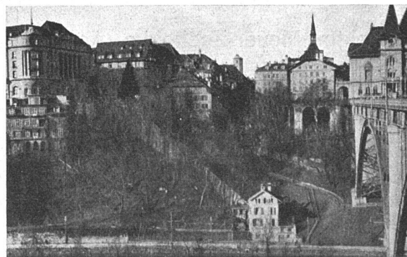
Ansicht der Baustelle vor Inangriffnahme der Arbeiten, rechts Kasino, links Bellevuehotel, Mitte die abzubrechenden Gerbergrabenbauten und ein Stück der alten Stadtmauer, die bleibt