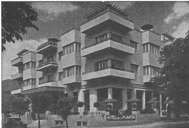
HOTEL DE LA PLANTA, SION (Valais) Architecte: A. de Kalbermatten