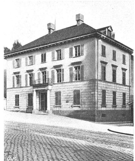
Der «Schönenhof»

hingenommen werden, während der Abbruch dieses Gebäudes für Zürich den höchst schmerzlichen Verlust eines Baudenkmals bedeuten würde, das gerade durch seine noble Bescheidenheit und Einordnung in den städtischen Zusammenhang und nicht durch artistische Brillanz eine stille, aber intensive Rolle im Stadtbild spielt.