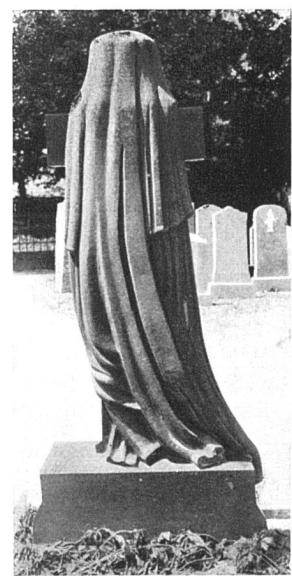
Die trauernde Witwe von hinten — und von vorn! Die Sucht, um jeden Preis originell zu sein, hat manchmal eine unfreiwillige Komik zur Folge, die hier nicht ganz am Platz ist