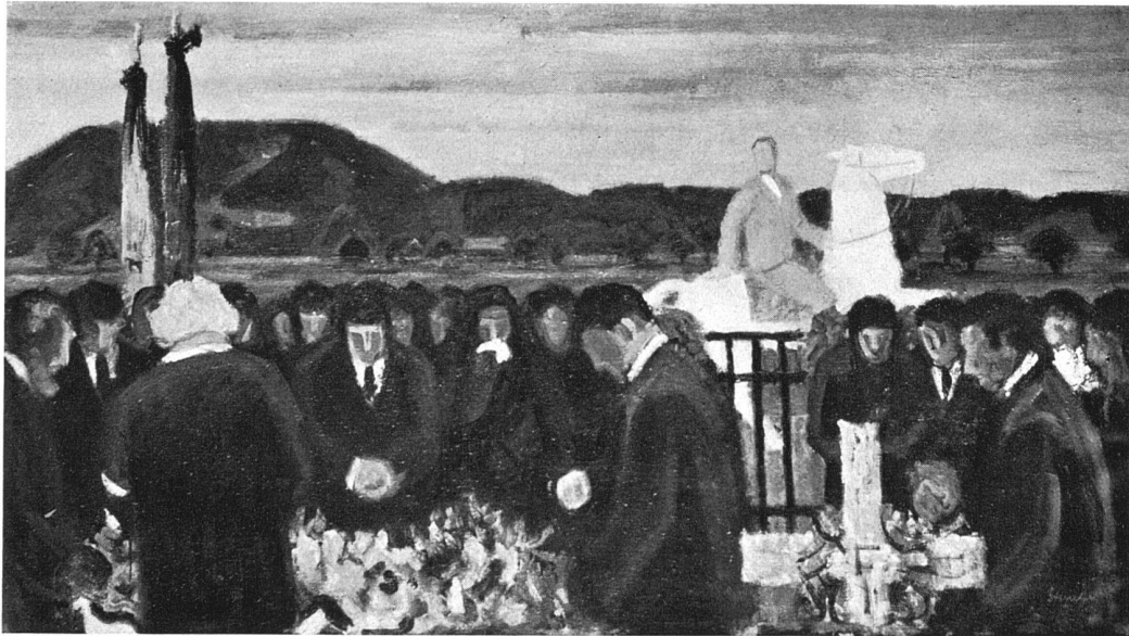
«Begräbnis mit Reiter», 1933/34, Oel, 140 × 190 cm