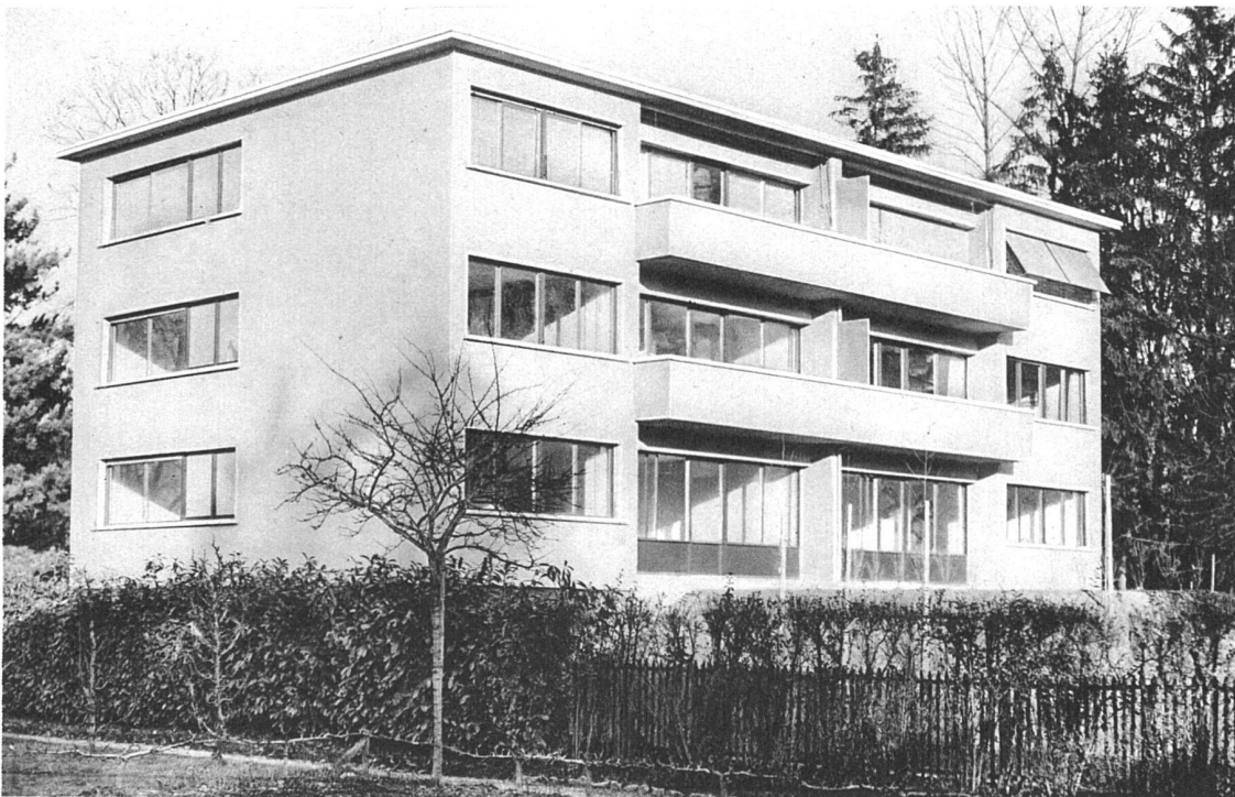
Maison collective de six appartements, Genève, route de Chêne Arnold Hoechel, architecte FAS, Genève, et Henri Minner, architecte FAS, Genève

pincées dans les brides de scellements. Le contact des tuyaux avec les dalles en béton armé est évité au moyen de manchons en liège.