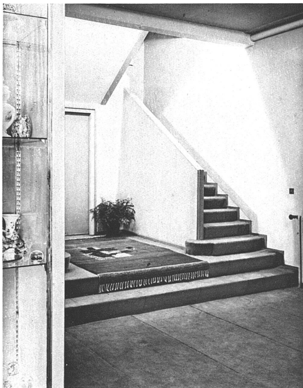
Modesalon Myrbor, Paris Architekt André Lurçat, Paris