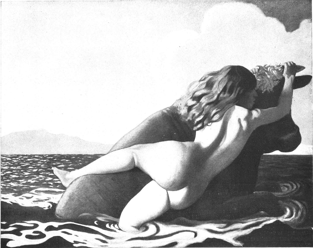
Felix Vallotton Europe 1928