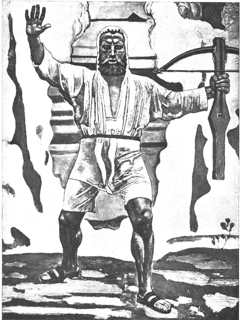
Ferdinand Hodler Tell, 1903 (zum Aufsatz über Felix Vallotton)