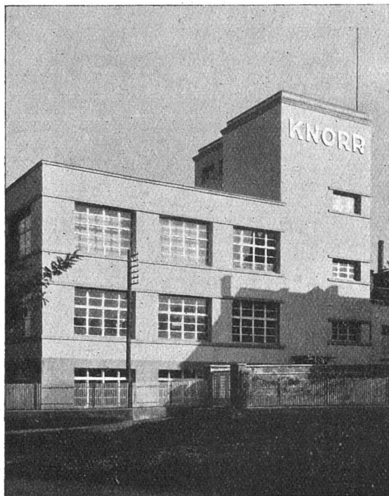
Neubau KNORR, Thayngen Abdichtung der Fundamentmauern mit CERESIT C. Schalch, Arch., Schaffhausen Lerch, Ulmi & Co., Bauunternehmung, Winterthur