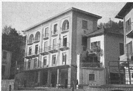
unten: was gleichzeitig am See gebaut werden darf, ohne dass irgend jemand protestiert