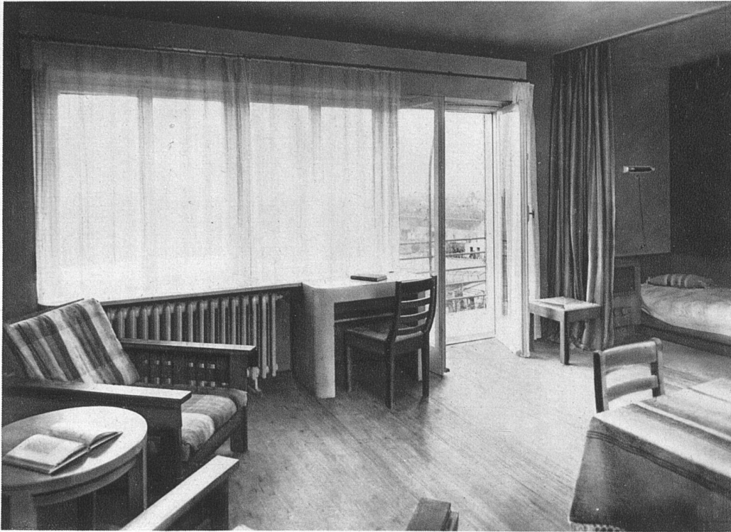
Innenräume des Teatro San Materno, Ascona Architekt Carl Weidenmeyer Wohn- und Schlafzimmer Fensterseite von Abb. S. 140 oben unten: Türwand