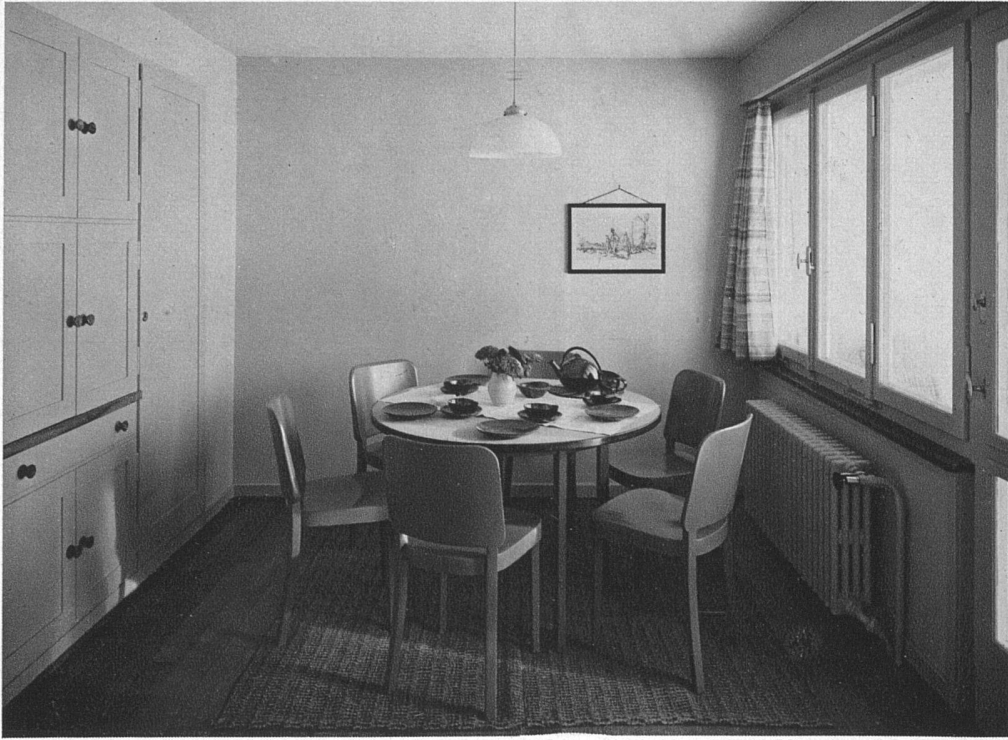
Innenräume der Siedlung «am Sonnenhügel», Glarus Hans Leuzinger, Architekt B.S.A., Glarus