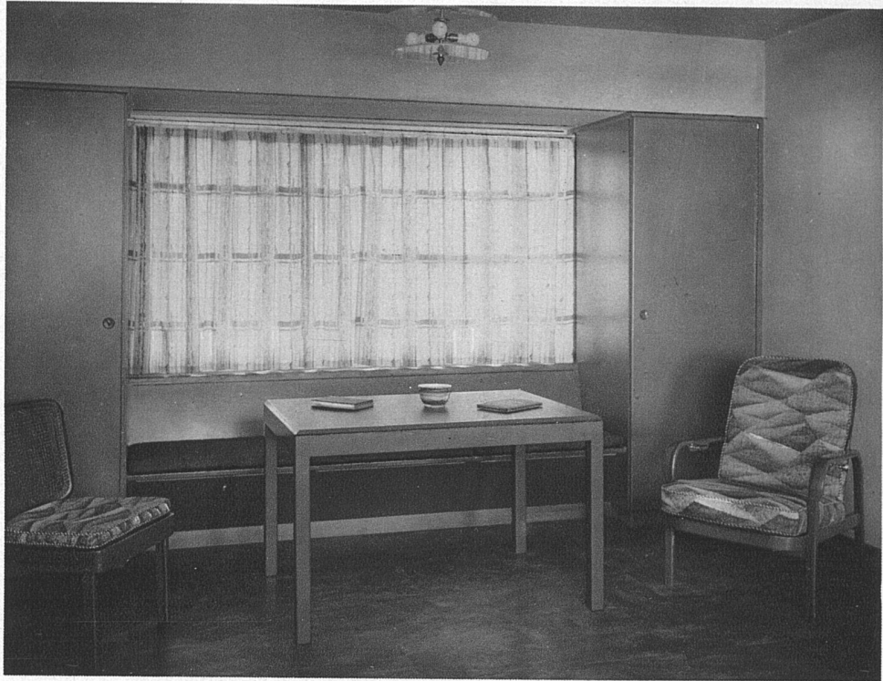
Gartenhaus in Ennenda Hans Leuzinger, Architekt B.S.A., Glarus oben: Nordfenster des Gartenzimmers unten: Südostecke des Gartenzimmers