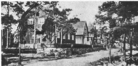
Schwedische Holzhäuser aus Gotenburg Ein- und Zweifamilienhäuser der Kolonie Landala 1917