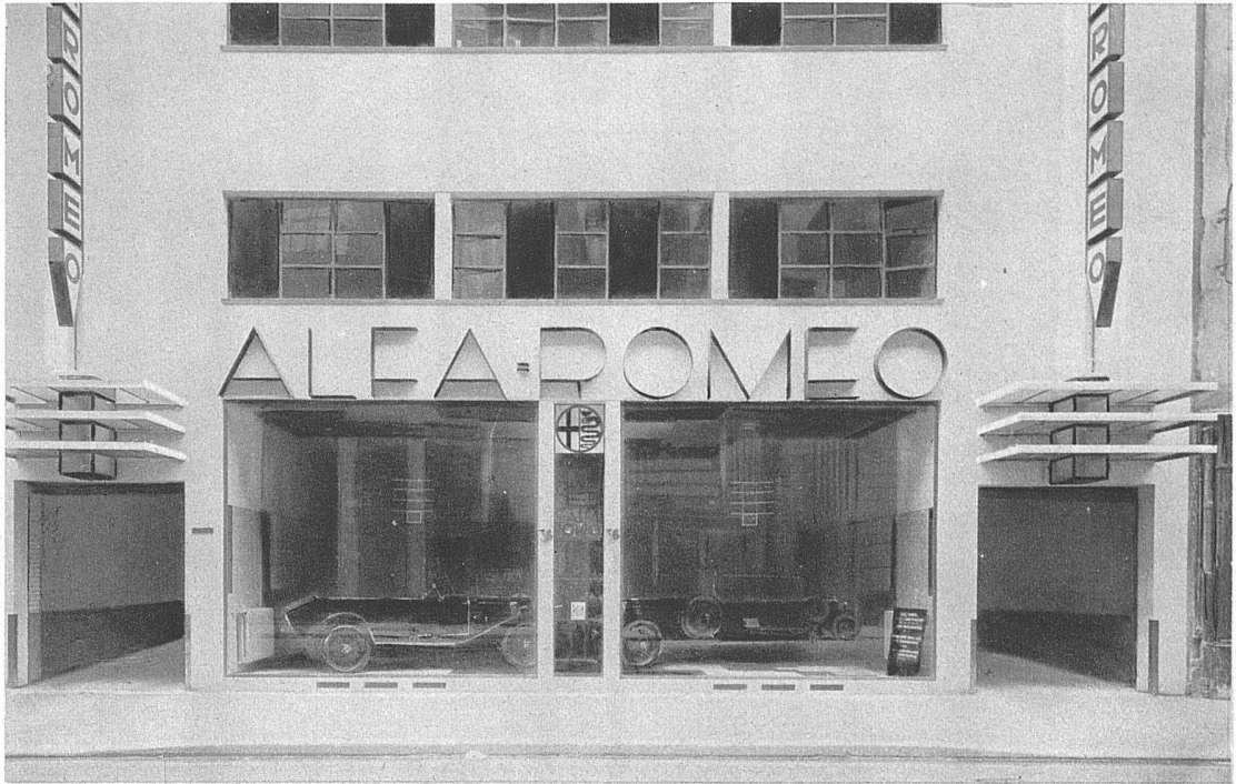
Fassaden des Geschäftsgebäudes der Autofirma Alfa-Romeo, Paris, Rue Marbeuf Arch. Robert Mallet-Stevens, Paris

Schaufenster des Ausstellungsraumes Die beiden Einfahrten führen zu den Lastenaufzügen der in drei Stockwerken angeordneten Garage