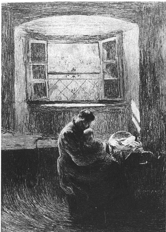
GIOVANNI GIACOMETTI / MUTTER UND KIND, 1909