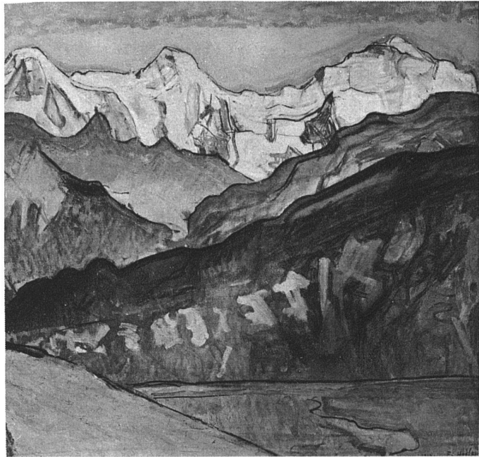
F. HODLER EIGER, MÖNCH, JUNGFRAU

mitteln. Zwar machte er keineswegs an den Landesgrenzen Halt. Von Van Gogh beispielsweise sicherte er sich ein paar erstklassige Stücke, als sie noch ganz billig und überdies zu ihrem und des Käufers Vorteil wirklich authentisch waren. Von Constantin Guys brachte er einen ganzen Blätterwald zusammen, vielleicht weil er Zeit gefunden hatte, Baudelaires herrliche Abhandlung zu lesen, noch eher aber, wer weiss das, weil sein Schützling Amiet sie in Pont-Aven gelesen hatte. Auf der andern Seite waren ihm selbst die Brücke-Leute nicht fremd. Im ganzen erhielt seine Sammlung aber zusehends schweizerische Färbung, und zwar der Haltung wie der Herkunft nach, obwohl neben dem alemannischen der welsche Teil weitgehend berücksichtigt wurde. Das war und ist nur in Ordnung. Wenn jeder sich zuerst in seinen vier Wänden umsehen würde, wäre vielerorten manches besser.