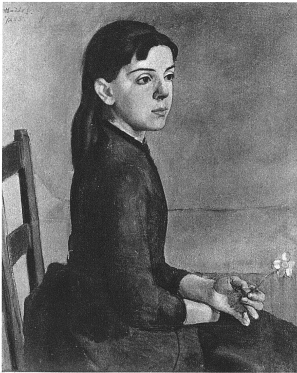
F. HODLER / MÄDCHEN MIT NARZISSE, 1885