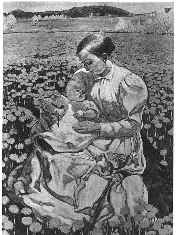
CUNO AMIET / MUTTER UND KIND IN DER LÖWENZAHNWIESE, 1903