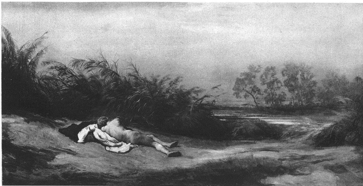
RUDOLF KOLLER / KNABE IM SCHILF