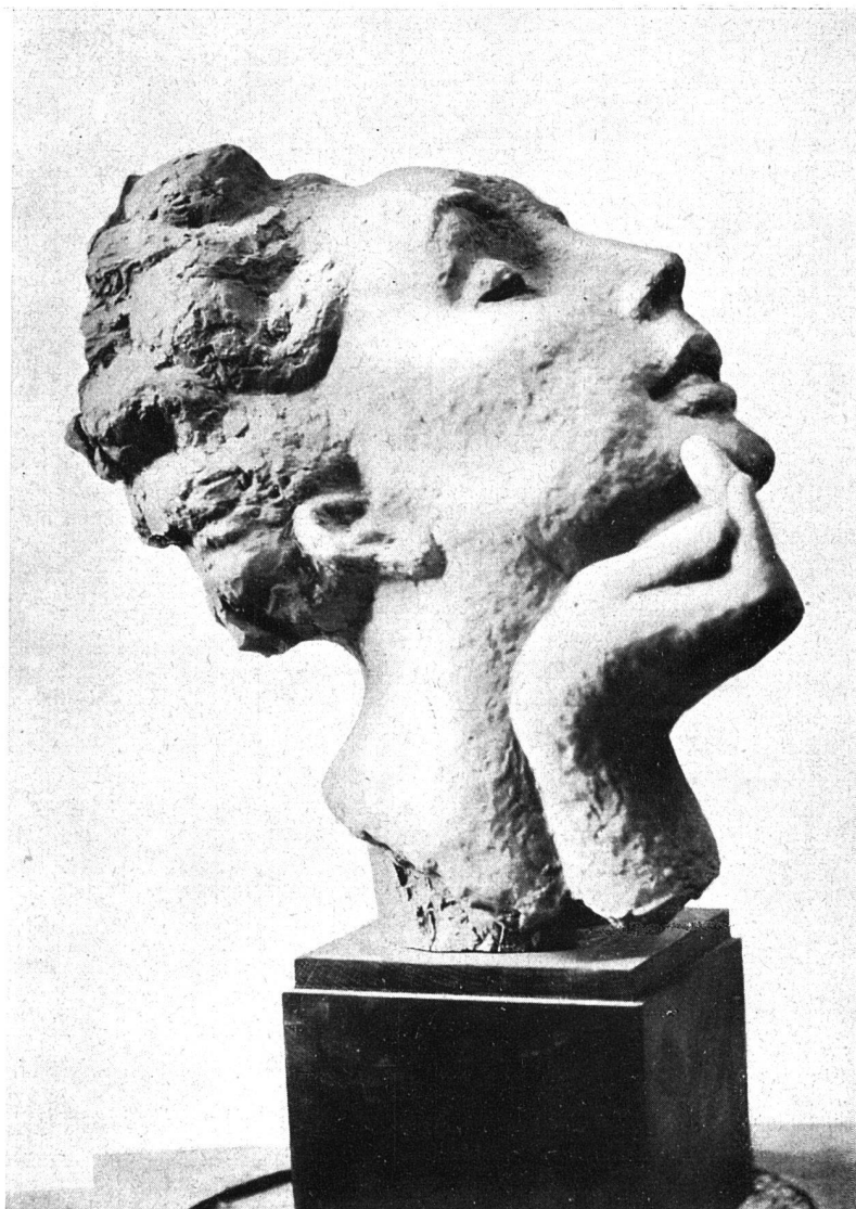
MAX WEBER, GENÈVE TORSO CUITE

styles correspondent sans doute à une double évolution: d'une part, l'artiste par le contact quotidien avec la matière finit par l'aimer d'un amour tel qu'il en pénètre plus complètement les exigences, qu'il s'établit entre elle et lui des rapports secrets et rigoureux — évolution technique d'abord — mais d'autre part, maturation de l'esprit: l'inspiration est d'une note plus grave, plus noble, plus calme, que l'on peut résumer en une phrase: du type de Diane, Max Weber a passé au type de Vénus (Eve, dit-il plus volontiers).