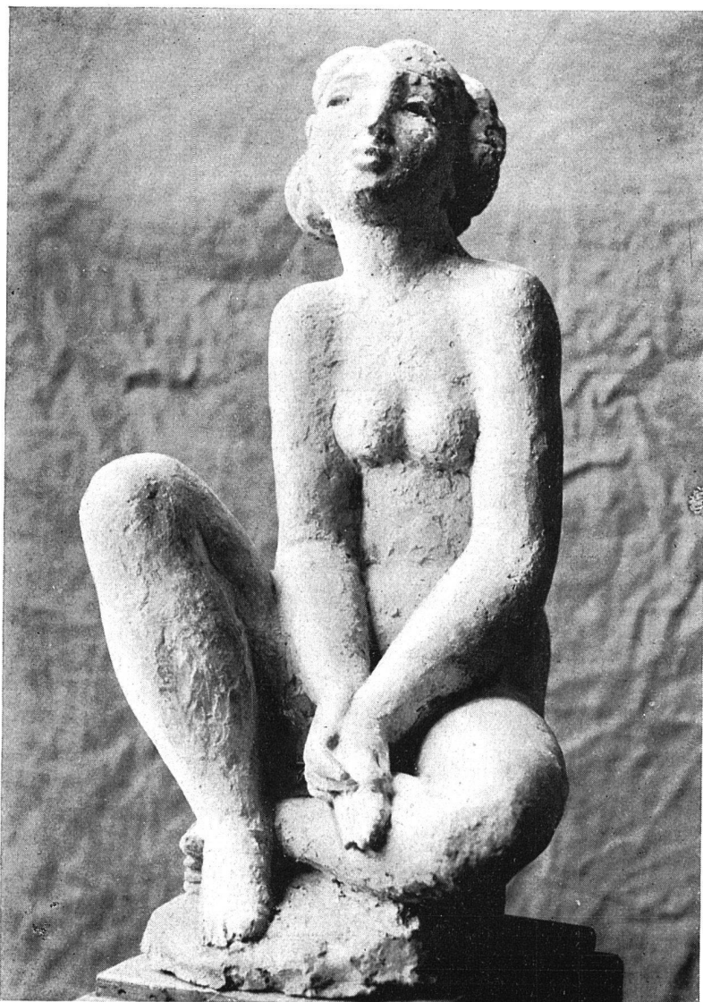
MAX WEBER, GENÈVE JEUNE FILLE ASSISE Hauteur 43 cm

montagnes, tempêtes, paroxysmes — que dans son essence même: les animaux, les fleurs, la femme. Max Weber, cela veut dire un monde de grâce, de sensibilité, de fantaisie: voici des chevaux, des colombes, voici surtout des jeunes femmes agiles.