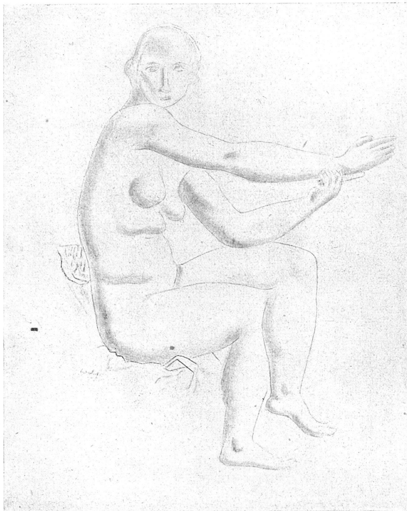
MAX WEBER, GENÈVE / DESSIN / 56 × 43 cm