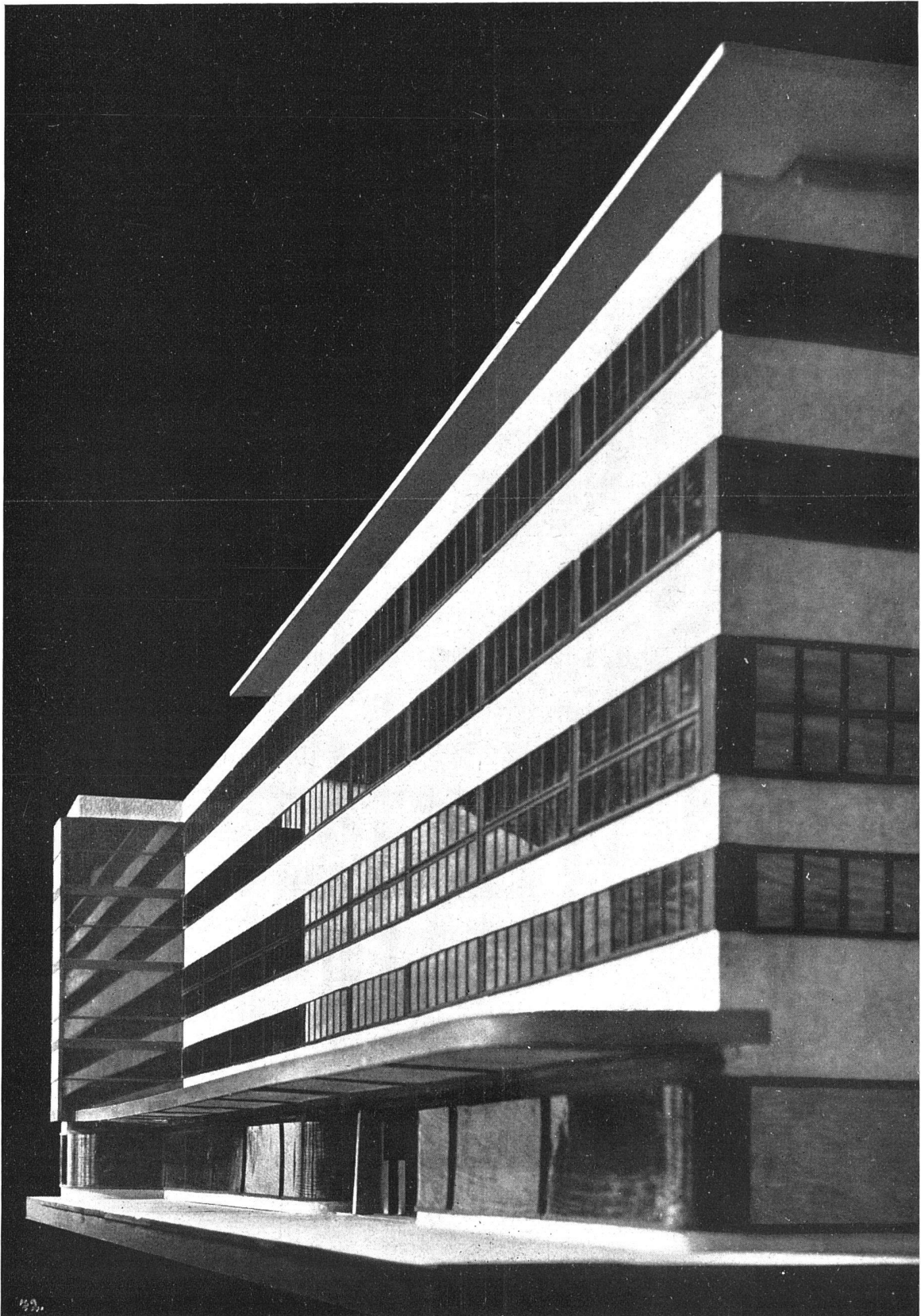
WARENHAUS WERTHEIM BERLIN / MODELLANSICHT / FRONT GEGEN DIE VERKEHRSREICHE SCHLOSSSTRASSE ARCHITEKT PROF. O. R. SALVISBERG B. S. A.

Den Frontabschluss bildet ein weit sichtbares Reklameschaufenster / Im obersten Geschoss Dachrestaurant und Garten