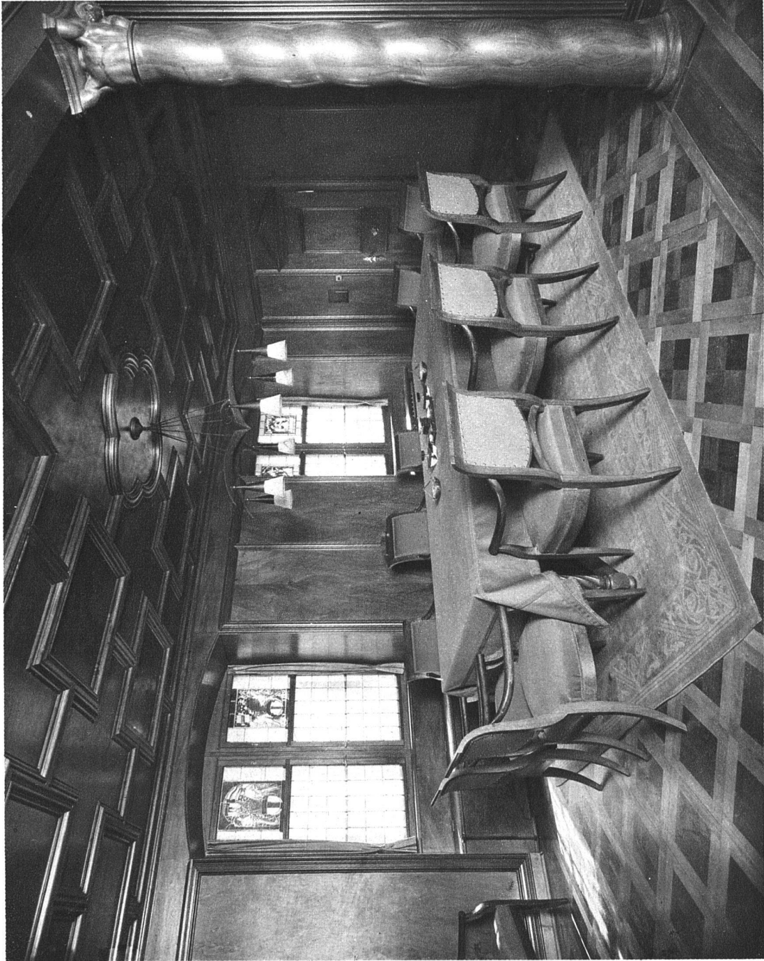
Stadtratsaal in Baden

Arch. Wildermuth, Winterthur