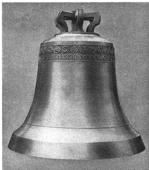
Oben: Glocke C 2630 kg / Solothurn, reformierte Kirche Mitte: Glocke As 5005 kg / Bern, Friedenskirche Unten: Glocke As / Frenkendorf, reformierte Kirche