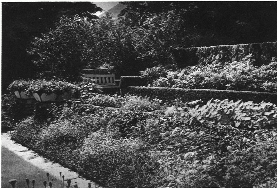
GARTEN SCHWEIZER Sitzplatz in der Südwestecke