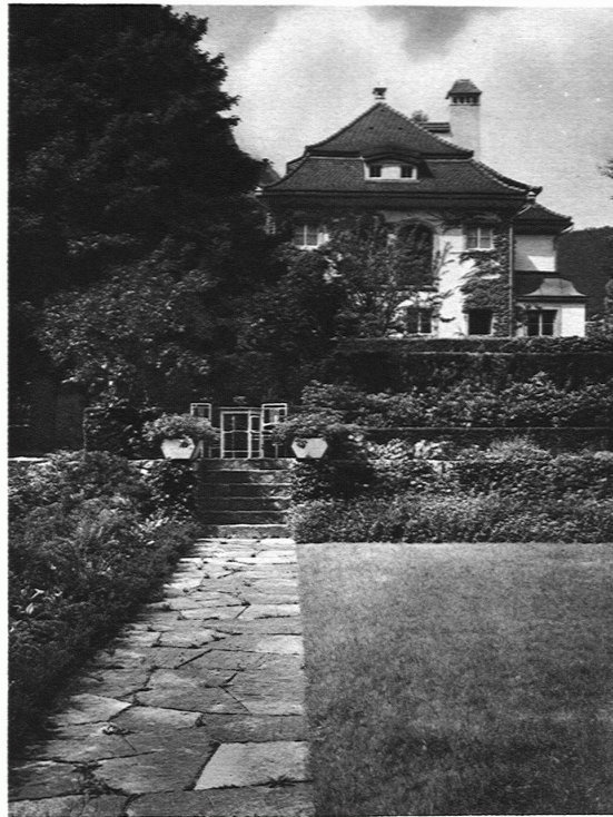
GARTEN SCHWEIZER, GLARUS Plattenweg / Das Wohnhaus vor dem Kriege erbaut durch Architekt Streiff