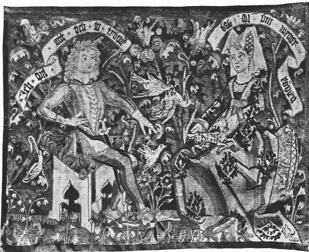
SCHWEIZER WIRKTEPPICH MIT LIEBESPAAR (1480—90) / NEWYORK, SAMMLUNG FRENCH

diejenigen, welche doch noch geblieben sind! Der Leser aber, der die Schlagworte heutiger Architekturkritik nicht kennt, ist nun erst recht im Unklaren, denn die kleinen Begleittexte zu den einzelnen Namen beschränken sich vernünftigerweise auf sachliche Angaben über Bildungsgang und Tätigkeit. In solchen knappen Charakteristiken ist de Fries meisterhaft, und diese seltene Fähigkeit sollte ihn eigentlich vor seinen beliebten Abstechern ins Weltanschaulich-Mystische bewahren. Es wirkt lächerlich, wenn ein Buch von so deutlichen propagandistischen Absichten mit dem Satze schliesst: »Die Idee bedarf nicht des Menschen; die Völker müssen sterben, auf dass Gott werde.« Das ist der berühmte Tropfen aus dem Becher der Philosophie! Glr.