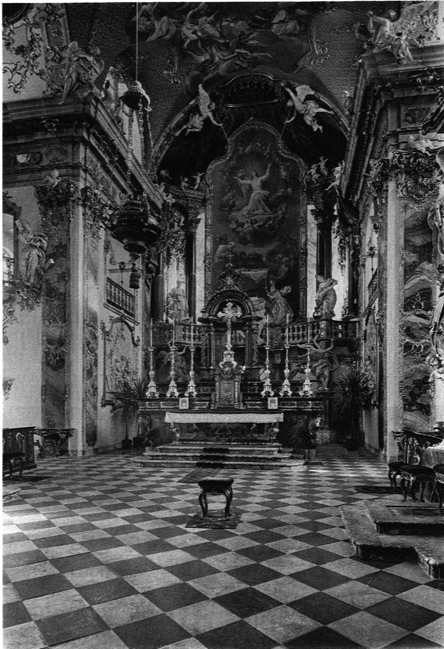
DER CHOR / 1746-48 DURCH FRANZ KRAUS UMGEBAUT DEKORATION VON DEN BRÜDERN TORRICELLI AUS LUGANO