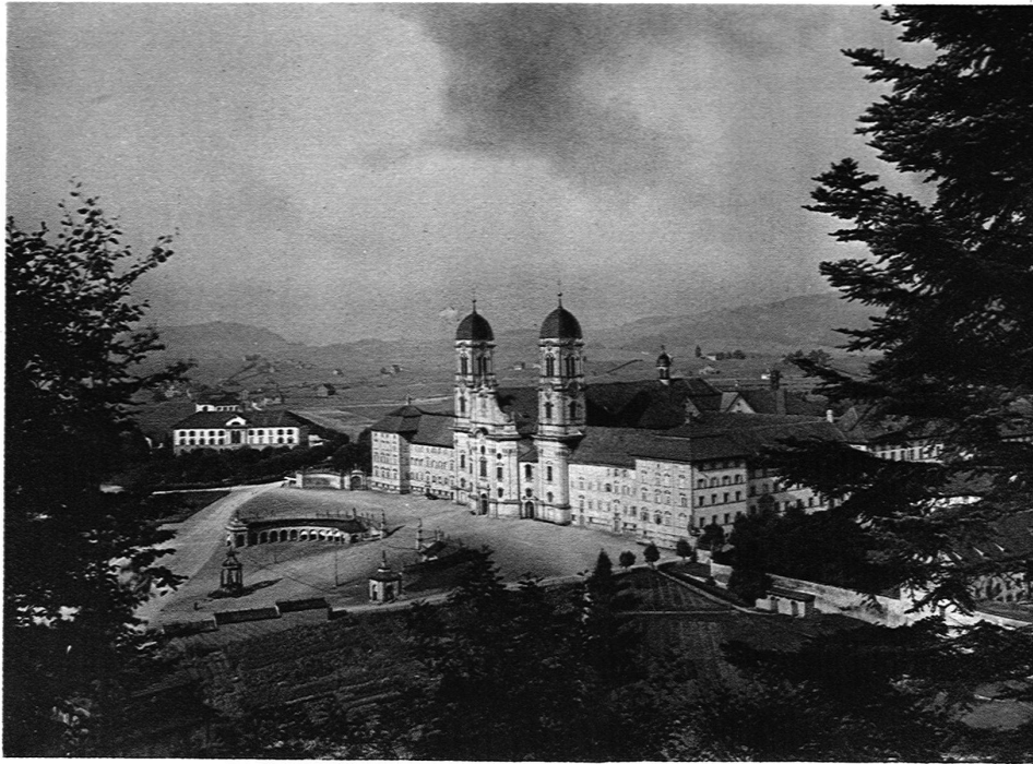
KLOSTER EINSIEDELN / GESAMTANSICHT VON SÜDWESTEN

Birchlers Stärke liegt ohne Zweifel in der Analyse. Er zerlegt etwa in dem ersten Kapitel die ganze Anlage wie mit dem Seziermesser, er verfolgt das einmal festgestellte architektonische Motiv bis in seine Verästelungen, und wer diesen Text fortwährend an den zahlreichen Bildtafeln des Anhangs und an den sauber gezeichneten Plänen kontrolliert, erhält eine sehr genaue Vorstellung von dem Werke des Caspar Mosbrugger. Ausgezeichnet, wie Birchler etwa den Gegensatz zwischen der flächigen Klosterfassade und der auf Tiefenwirkung angelegten Kirchenfront schildert, wie er die »Vorarlberger Bauformen« (Längstonne im Hauptschiff, Quertonnen zwischen den eingezogenen Streben der Seitenschiffe) charakterisiert, wie er die komplizierten Wölbungsverhältnisse im Oktogon klarlegt — hier hätten ein paar Achsenschnitte gute Wirkung getan — und wie er schliesslich im letzten Kapitel von den Plänen Mosbruggers für Einsiedeln aus die übrigen zum Teil fraglichen