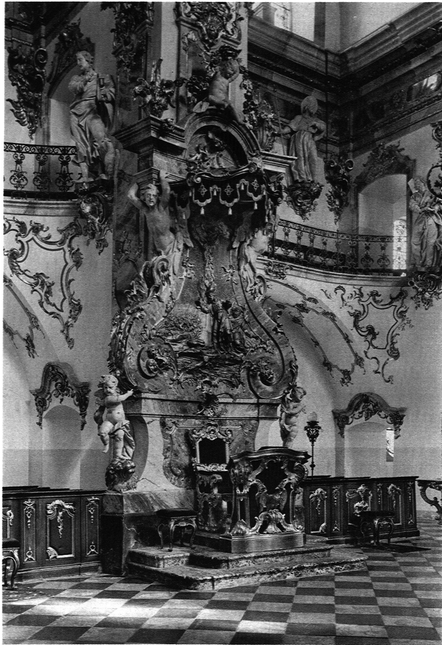
DER THRON DES FÜRSTABTES IM CHOR