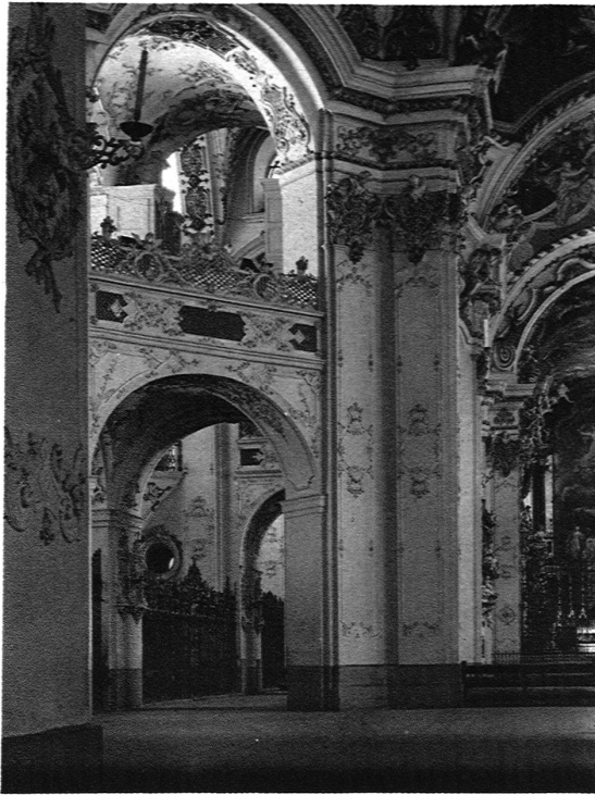
TRIBÜNE IM OKTOGON. Architekt Mosbrugger (1719-23) / Dekoration von den Brüdern Asam (1724-34) / Phot. Sander

Werke des Architekten betrachtet. In all diesen Untersuchungen liegt eine immense Forschungsarbeit, die allein schon dem Buche seinen Wert sichert.