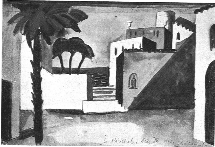
VINCENT-VINCENT / DÉCOR POUR «LA PÉRICHOLE», ACTE IV.