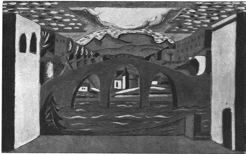
VINCENT-VINCENT / DÉCOR POUR «LES PIRATES DE LA SAVANE»

La simplification de la décoration dramatique était une réaction contre la richesse, un tantinet ampoulée et lourde, d'un Bakst ou d'un Erler et contre les harmonies rutilantes — souvent vulgaires — des Russes. On s'imaginait revenir, sous une forme déguisée avec assez de rouerie, au classicisme, alors que — tout compte fait — l'on retombait purement et simplement dans une manière d'académisme faisandé.