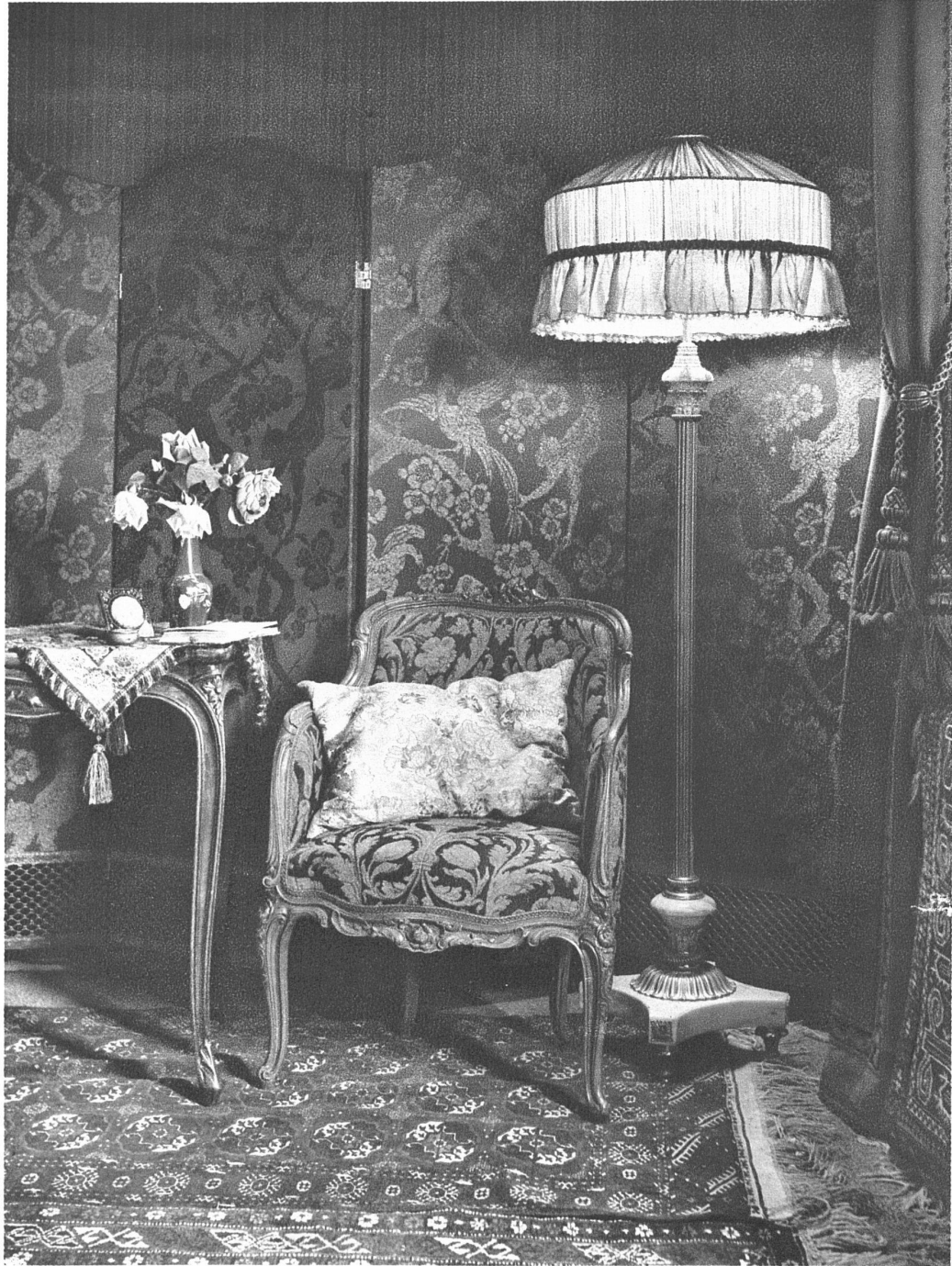
ECKE IN EINEM BOUDOIR J. KELLER & CIE., MÖBELFABRIK, ZÜRICH