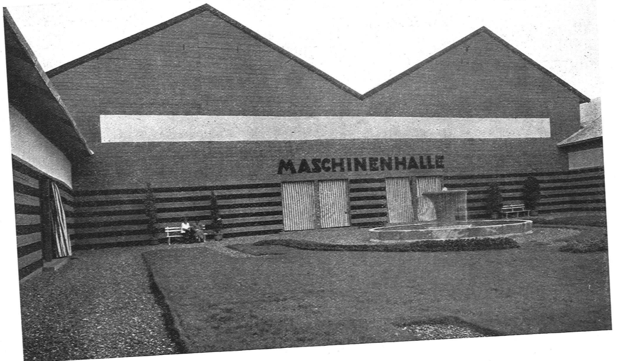
DER KLEINE HOF