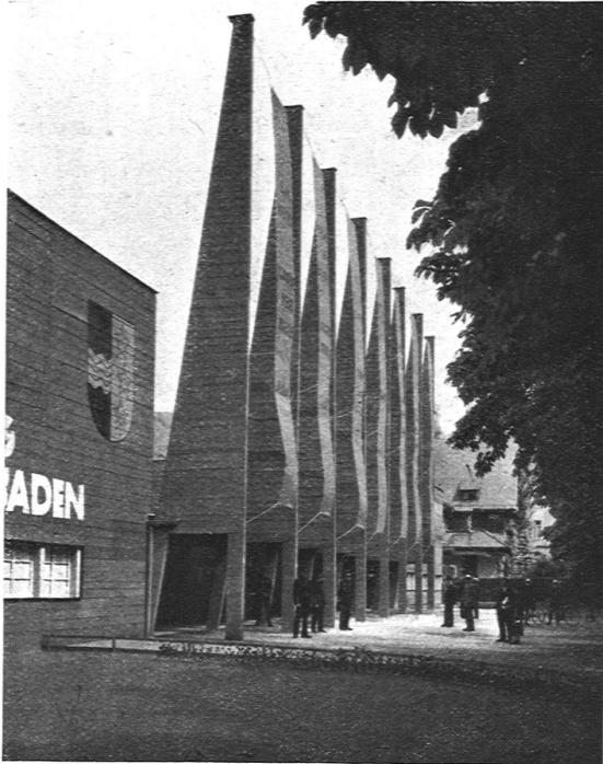
EINGANG AN DER PARKSTRASSE

Die Stadt Baden, in welcher gegenwärtig architektonische Aufgaben grössten Stiles in Angriff genommen werden (Hochbrücke über die Limmat, neues Schulhaus mit Sport- und Badeanlage), beherbergt seit 1. Juli auf einem schönen Gelände in unmittelbarer Nähe des bekannten Kursaals die Gewerbeausstellung des Kantons Aargau. Wenn wir hier zum erstenmal Gelegenheit nehmen, eine der vielen Gewerbeausstellungen, mit denen unser Land in den letzten Jahren gesegnet war, eingehender zu besprechen, so geschieht es vor allem mit Rücksicht auf die Architektur der Ausstellung , die schlechthin das Beste ist, was auf diesem Gebiete seit langem bei uns geleistet wurde. Man darf die Anlage des Architekten Albert Maurer B. S. A. (in Firma Vogelsanger & Maurer, Rüschiikon), dessen mit dem ersten Preis ausgezeichnetes Wettbewerbsprojekt ohne wesentliche Veränderungen ausgeführt werden konnte, in erster Linie damit charakterisieren, dass sie reine Ausstellungsarchitektur ist, dass sie in eindeutiger Art mit dem Hauptmaterial, dem Holze, rechnet, und dass sie schliesslich die dekorative Malerei sich in einer Weise dienstbar gemacht hat, die nicht genug zur Nachahmung empfohlen werden kann. Die Ausstellungshallen, in denen die Produkte des aargauischen Gewerbes vom Schmelzofen bis zum Batiktüchlein Platz finden mussten, gruppieren sich im wesentlichen um zwei