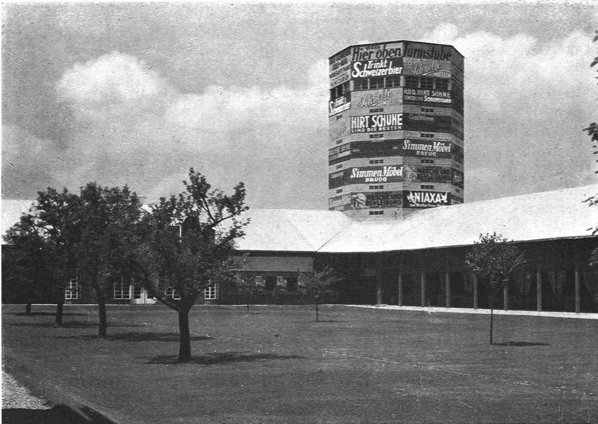
DER GROSSE HOF MIT DEM REKLAMETURM