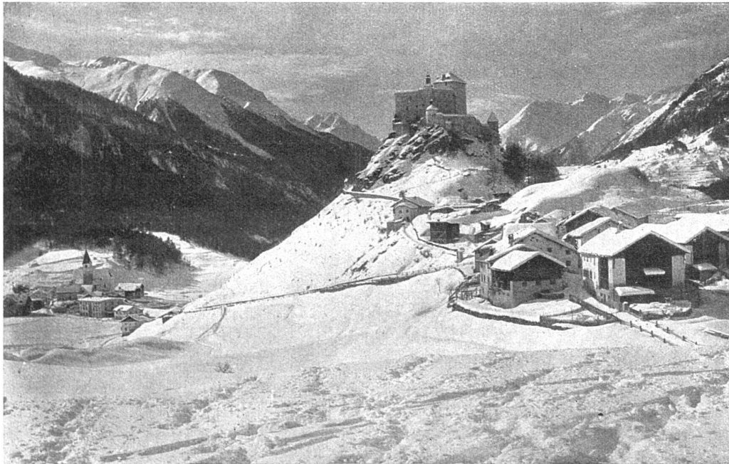
Schloss Tarasp, beheizt mit Catena-Kesseln

STREBELWERK - ZÜRICH RÄMISTRASSE 5 TELEPHON: HOTTINGEN 49.33