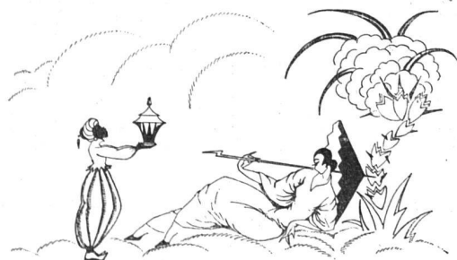
KUNSTGEWERBLICHE WERKSTÄTTE B. WEBER-HOFMANN, ZÜRICH · ZELTWEG 66 Seidene Lampenschirme, Kissen, Decken, Teepuppen nach eigenen künstlerischen Entwürfen

Spezialgeschäft für Zimmerei, Schreinerei und Fensterfabrikation, Dampfsäge, Holzhandlung Ausführung von Chalets, innerer und äusserer dekorativer Holzarbeiten, Zimmereinrichtungen