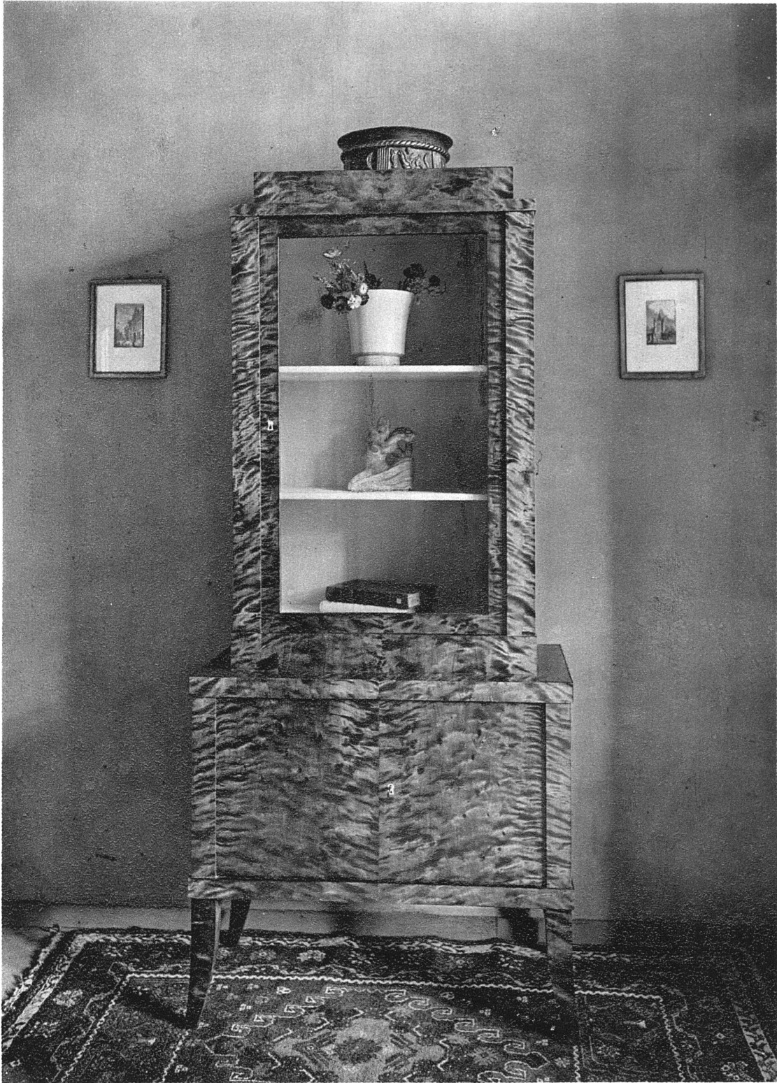
ABB. 9 ZIERSCHRANK IN FINNISCHER BIRKE ENTWURF UND AUSFÜHRUNG VON HANS BUSER, BASEL-BRUGG