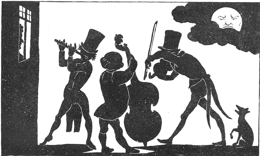
NACH DEM „SCHATTENSPIEL“ VON FRANZ POCCHI, MÜNCHEN 1847

mittelalterlichen Tonkunst zur Pflicht, ja zur Notwendigkeit geworden ist, so erhebt sich die Frage, in welchen Räumen diese in sich geschlossene, ihrem innersten Wesen nach dem heutigen Musikbetrieb zwar so ferne, dem musikalischen Gestaltungswillen der Gegenwart jedoch so verwandte Ton-Welt zum Klingen gebracht werden kann. Wie bei der musealen Darbietung der mittelalterlichen bildenden Künste wird es hierbei die Aufgabe sein, die rein künstlerischen Elemente herauszuarbeiten, die ohne Bezug auf den liturgischen Entstehungskomplex in diesen Werken lebendig sind.