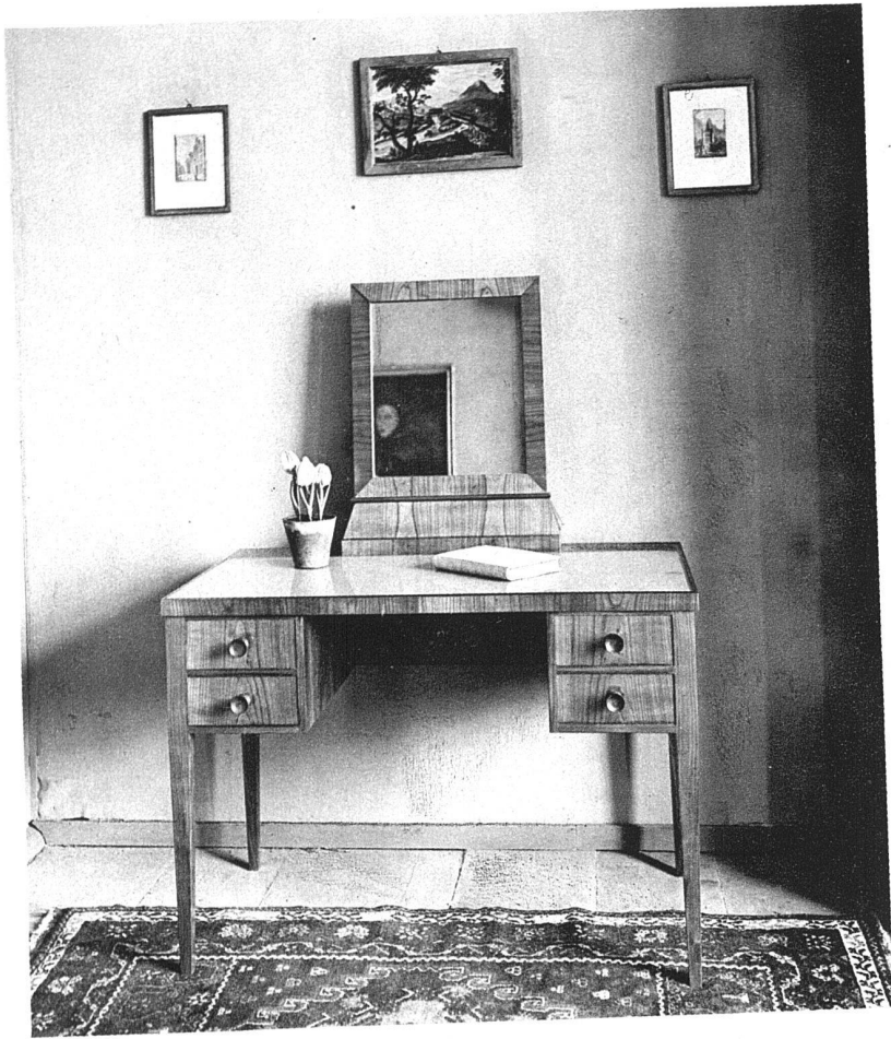
ABB. 10 UND 11 TOILETTENTISCH (KIRSCHBAUM) UND WOHNZIMMERSCHRANK (FINNISCHE BIRKE) ENTWURF UND AUSFÜHRUNG VON HANS BUSER, BASEL-ERUGG