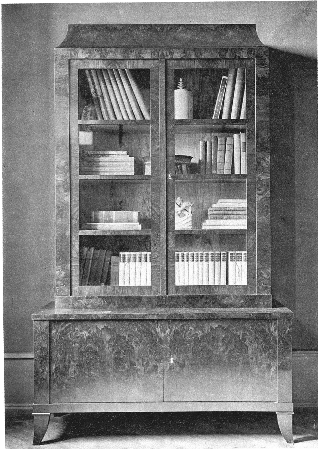
ABB. 8 BÜCHERSCHRANK ENTWURF UND AUSFÜHRUNG VON HANS BUSER, BASEL-BRUGG (NUSSBAUM, FLAMMENMASER)