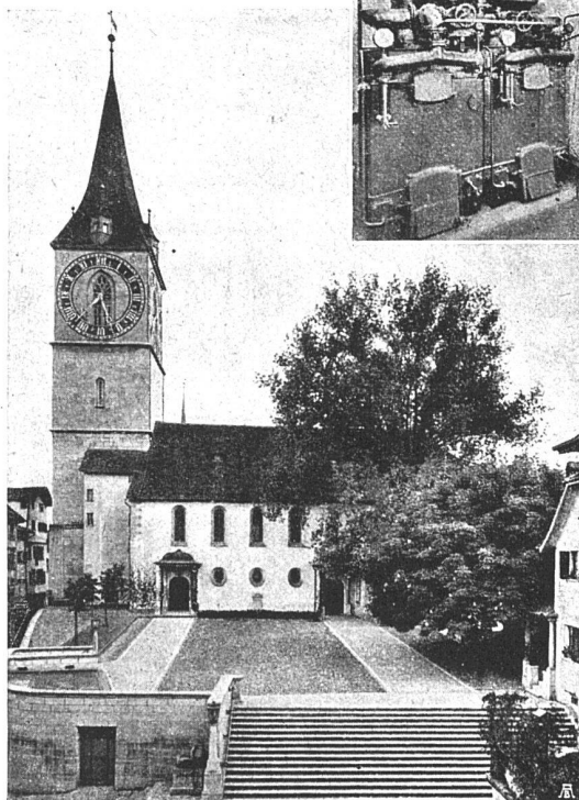
Kirche St. Peter, Zürich STREBEL-ECA-KESSEL